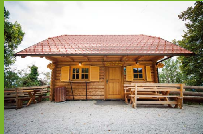
Lesena brunarica in notranjost

Od leta 2004 Turistično društvo Gora, intenzivno obnavlja objekte na gori, zgradili pa so tudi nekaj novih.